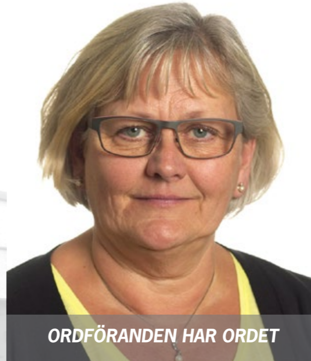
ORDFÖRANDE HAR ORDET